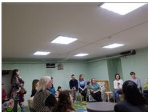
Общий вид Часть общего вида