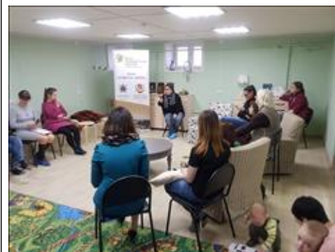
Общий вид Часть общего вида