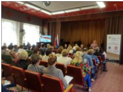
Общий вид Часть общего вида