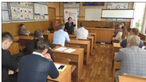
Общий вид Часть общего вида