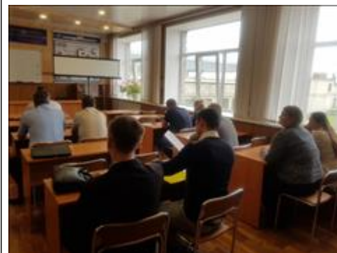
Общий вид Часть общего вида