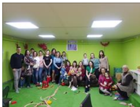
Гости семейного клуба "Йоль. г. Смоленск" Фото гостей семейного клуба, принявших участие в тематической встрече

Информация, указанная Вами в данном поле отчета, будет доступна для посетителей сайта Фонда президентских грантов (в том числе представителей СМИ)