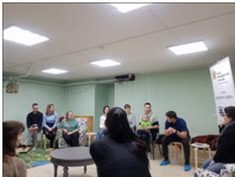
Общий вид Часть общего вида