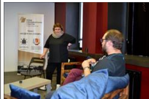
Дискуссия Дискуссия участников тематической встречи о пользе и вреде президентских грантов для некоммерческих организаций

Мероприятие: Тематическая встреча «Территориальное общественное самоуправление - потенциал развития гражданского общества».