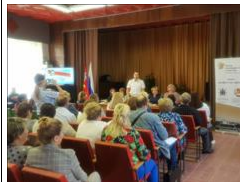
Выступление сотрудника полиции Сотрудник полиции предостерег граждан от новых видов мошенничества