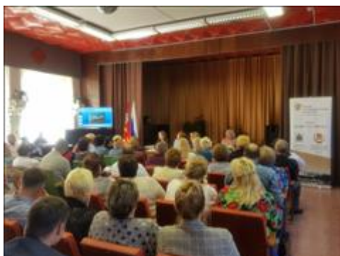
Конкурсы для ТОС Государственные гражданские служащие Департамента Смоленской области по внутренней политике рассказывают о конкурсах для ТОС