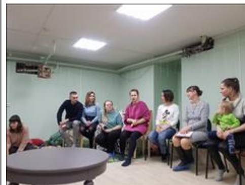
Вальдорфский детский сад Представитель Вальдорфского детского сада рассказывает об их деятельности