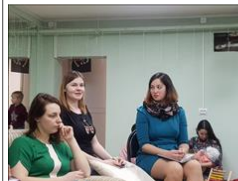
Руководители семейного клуба "Йоль. г. Смоленск" Руководители семейного клуба рассказывают о нём