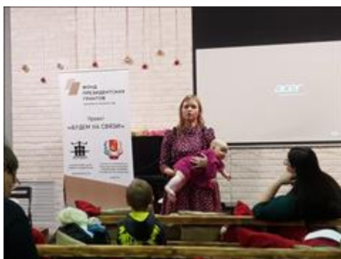
"Свободный микрофон" Обращение за оказанием адресной помощи