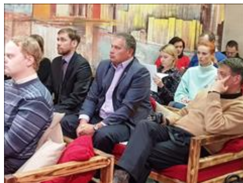
Зал Часть общего вида зала

Информация, указанная Вами в данном поле отчета, будет доступна для посетителей сайта Фонда президентских грантов (в том числе представителей СМИ)