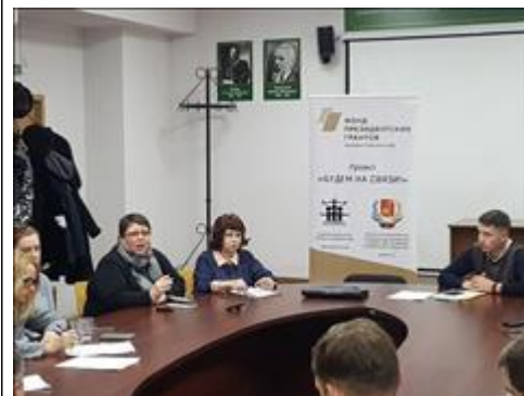
Вступительное слово Руководитель проекта "Будем на связи!" рассказывает о проекте