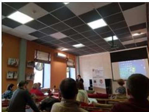
Общий вид Часть общего вида