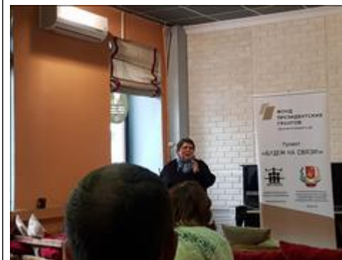
Приветственное слово Руководитель проекта "Будем на связи!" приветствует участников тематической встречи