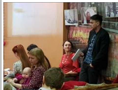
"Свободный микрофон" Предложения новых форм сотрудничества