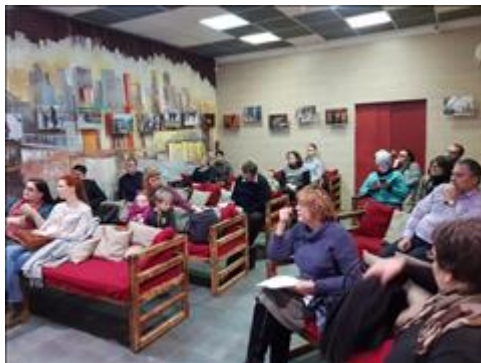
Общий вид Часть общего вида