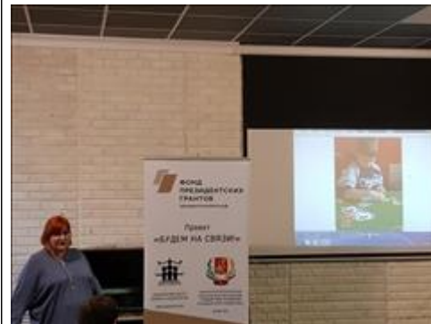
Презентация Презентация деятельности Автономной некоммерческой организации дополнительного образования Психолого-логопедический центр "РАЗВИТИЕ"

Аудио записи всех публичных мероприятий проекта доступны по ссылке https://yadi.sk/d/GiaheiFzMYTFuA