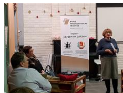
"Свободный микрофон" Обмен мнениями