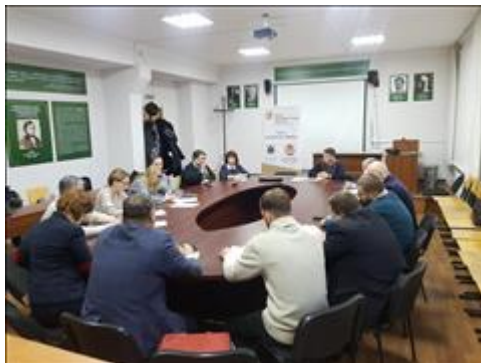
Общий вид Общий вид мероприятия